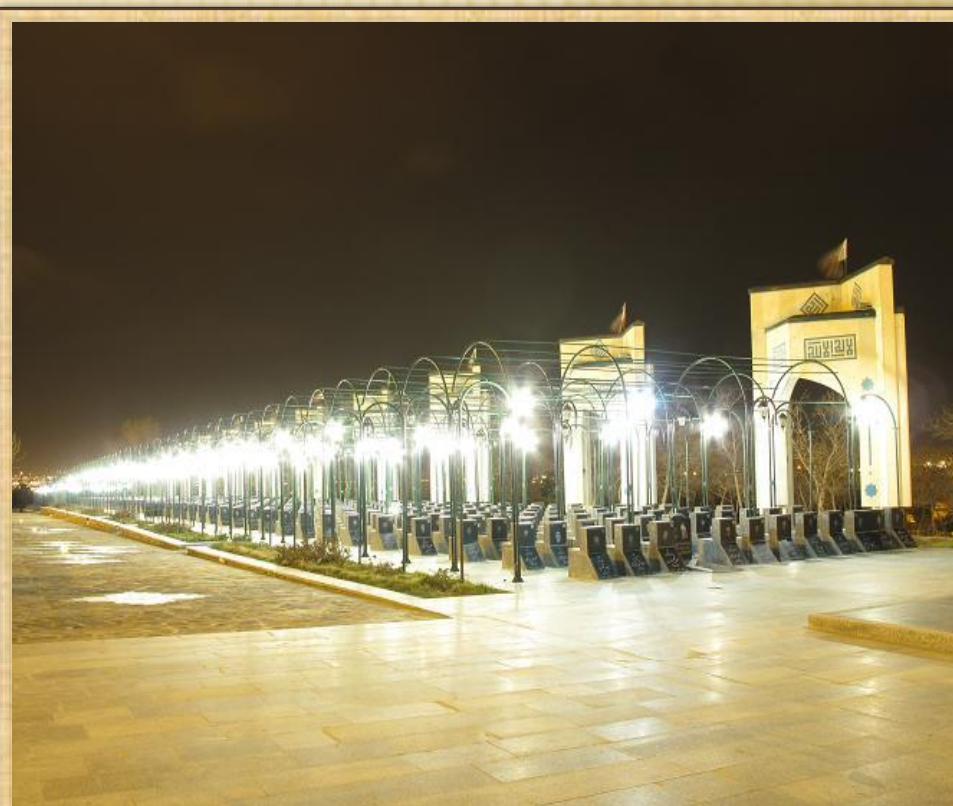
گلزار شهدای مرکزی شهر همدان